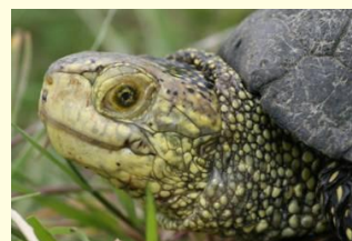
Cistude d'Europe