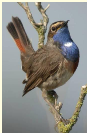
Gorgebleue à miroir de Nantes