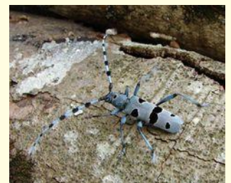
Rosalie des Alpes © V. Bertin