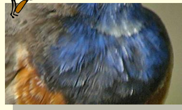
La gorge-bleue à miroir