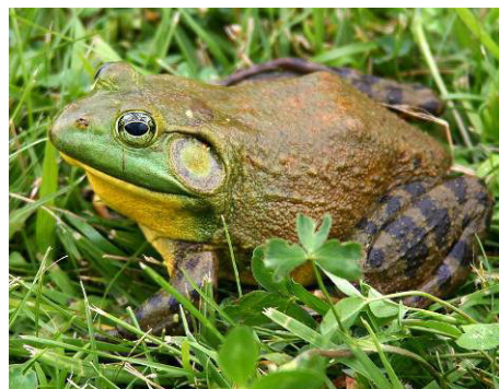
Grenouille taureau mâle (Carl D. Howe)