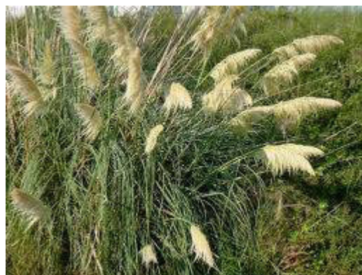
Herbe de la pampa