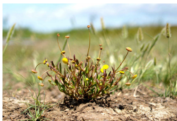
Cotule à feuille de coronopus (CBNSA)