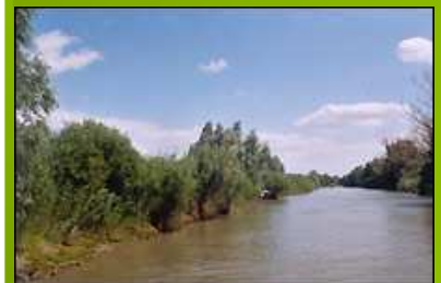
Habitat privilégié du Crabier chevelu.

Berne : annexe II Bonn: annexe II Washington: annexe II Espèce protégée