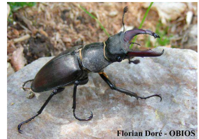
Florian Doré - OBIOS

La taille des adultes varie de 20 à 50 mm pour les femelles et de 35 à 85 mm pour les mâles. C'est le plus grand coléoptère d'Europe. Le corps est de couleur brun-noir ou noir, les élytres parfois bruns. Le pronotum est muni d'une ligne discale longitudinale lisse. Chez le mâle, la tête est plus large que le pronotum et pourvue de mandibules brun-rougeâtre de taille variable (pouvant atteindre le tiers de la longueur du corps) rappelant des bois de cerf. Elles sont généralement bifides à l'extrémité et dotées d'une dent sur le bord interne médian ou post-médian. Le dimorphisme sexuel est très important. Les femelles ont un pronotum plus large que la tête et des mandibules courtes.