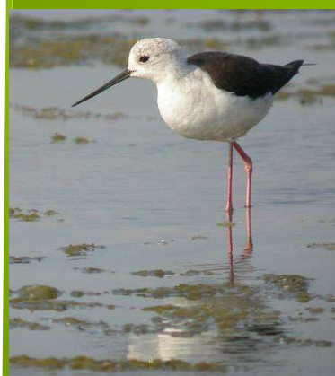
L'Echasse, bien que d'allure fragile, est un migrateur au long cours. Elle hiverne en Afrique.