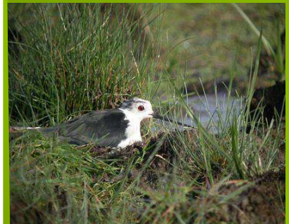
Echasse blanche sur son nid.

En Poitou-Charentes, l'espèce ne niche qu'en Charente-Maritime. Sur la période 2008-2010, la population départementale a varié entre 470 et 540 couples.