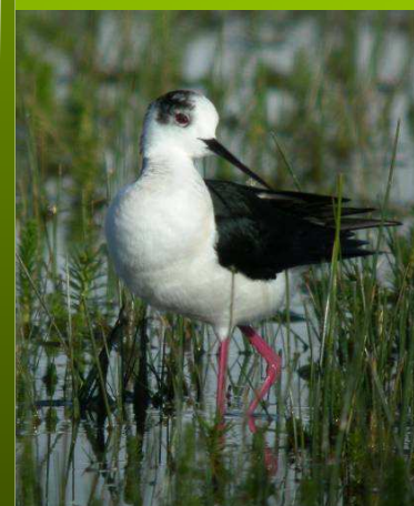
Les dépressions humides végétalisées sont particulièrement riches en proies.