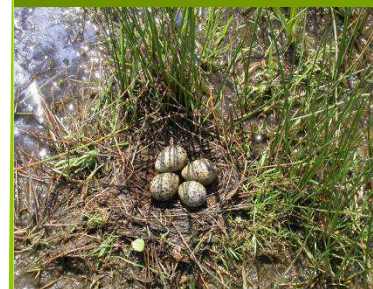
Le nid de l'échasse n'est qu'une petite cuvette, vite noyée en cas de montée des eaux.