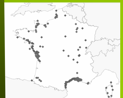
Répartition de l'Echasse blanche.